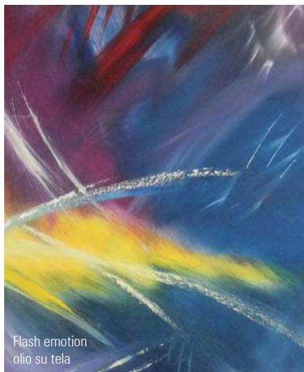
Flash emotion olio su tela

valorizzando le loro potenzialità ottiche nella relazione tra le macchie, i segni e le forme. Secondo il principio kandischiano della “necessità interiore” il colore è un mezzo per influenzare l'anima. Disponendo con mestiere ampie e veloci campiture, sovrapponendo taglienti pennellate e gocciolature di colore, Luca De Marchi cerca di promuovere un moto interiore, una reazione emotiva nel fruitore. Significativi sono i titoli quali “Flash emotion”, “Absolute impression”, “Sensual Atmosphere” o “Vital and emotion evolution”. Le tonalità accese dei rossi, dei