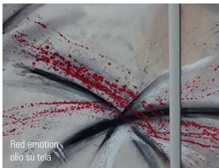
Red emotion olio su tela