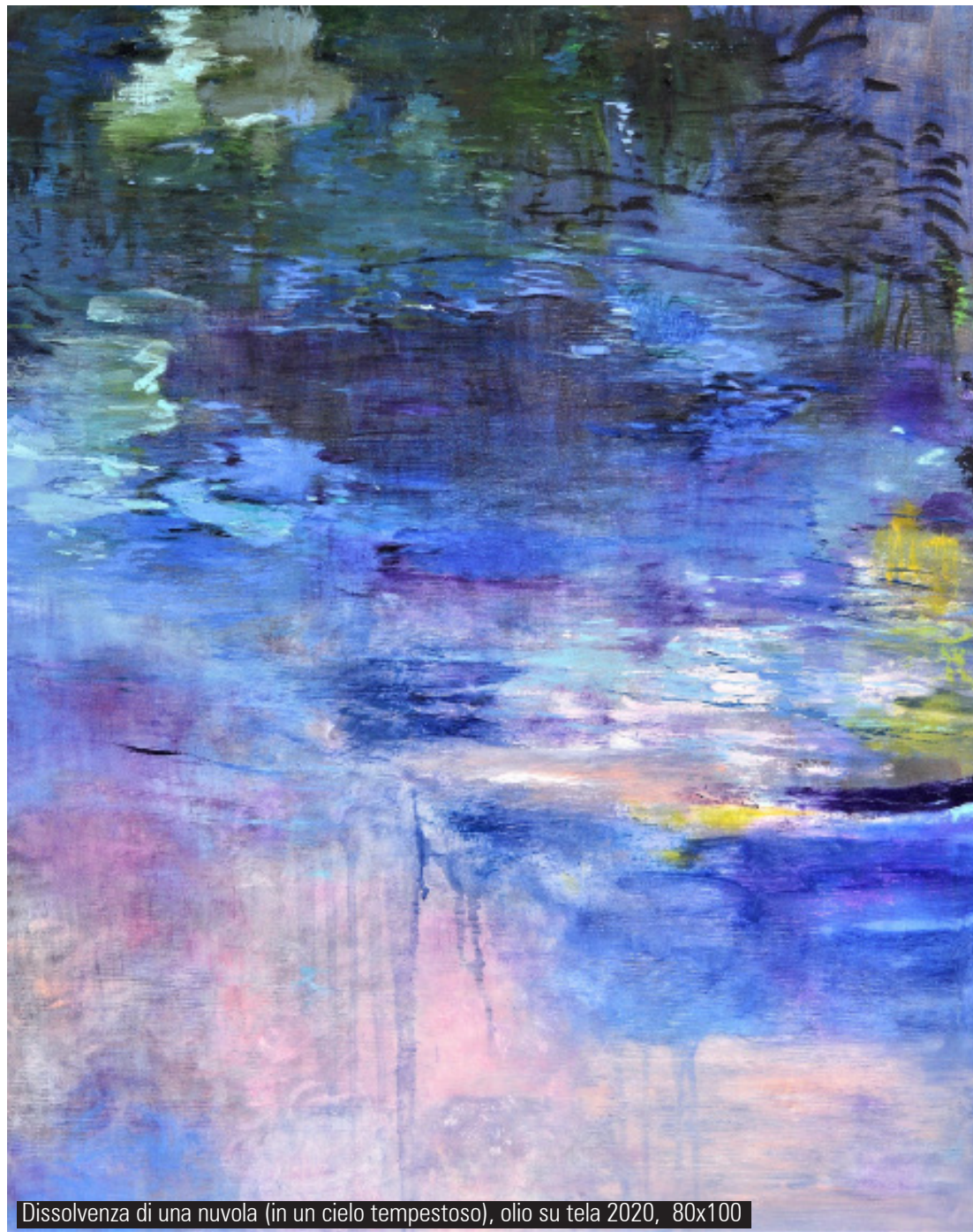
Dissolvenza di una nuvola (in un cielo tempestoso), olio su tela 2020, 80x100