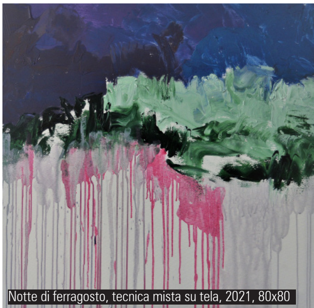
Notte di ferragosto, tecnica mista su tela, 2021, 80x80