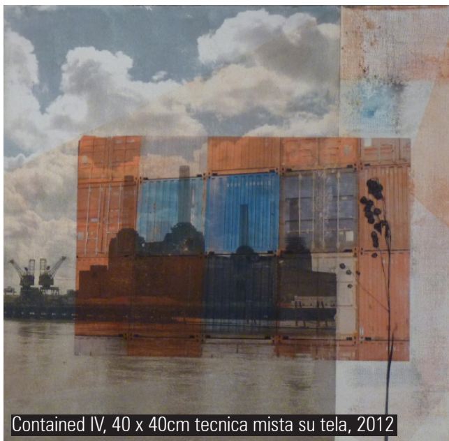
Contained IV, 40 x 40cm tecnica mista su tela, 2012