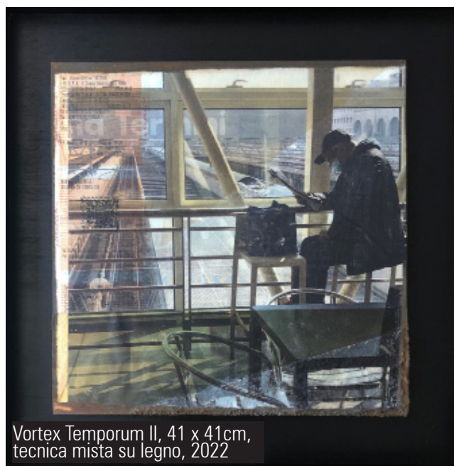
Vortex Temporum II, 41 x 41cm, tecnica mista su legno, 2022

scandita dalla calibrata geometria delle architetture. Le serie Urban life e Urban silence esprimono chiaramente la contrapposizione tra la rumorosa vita quotidiana e gli spazi vuoti e i silenzi della solitudine esistenziale umana. La strada, la stazione, le scale mobili, il treno sono i luoghi in cui il fluire delle persone si addensa per poi disperdersi fino a lasciare spazio alle imponenti architetture, in cui le superfici grigie del cemento si estendono come materiche pause di solitudine . La produzione più recente è segnata dalla serie degli Scape , paesaggi esistenziali, in cui la figura umana appare completamente isolata o addirittura scompare per lasciare spazio al germoglio di una pianta. Assenze e presenze,